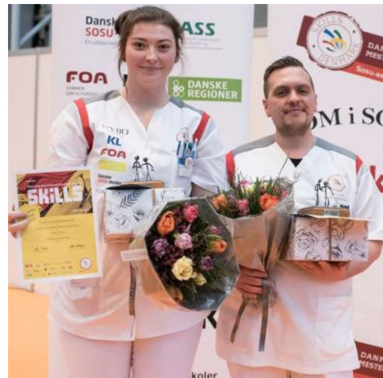
Vinderne af DM i SOSU 2020.

Læs her i folderen om, hvordan det foregår.